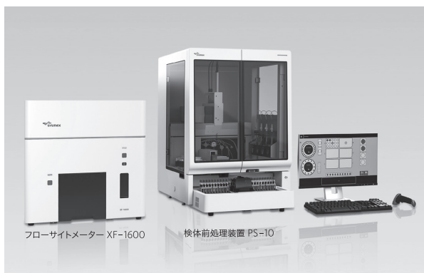
フローサイトメーター XF-1600