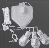
血漿処理ユニット CP-3